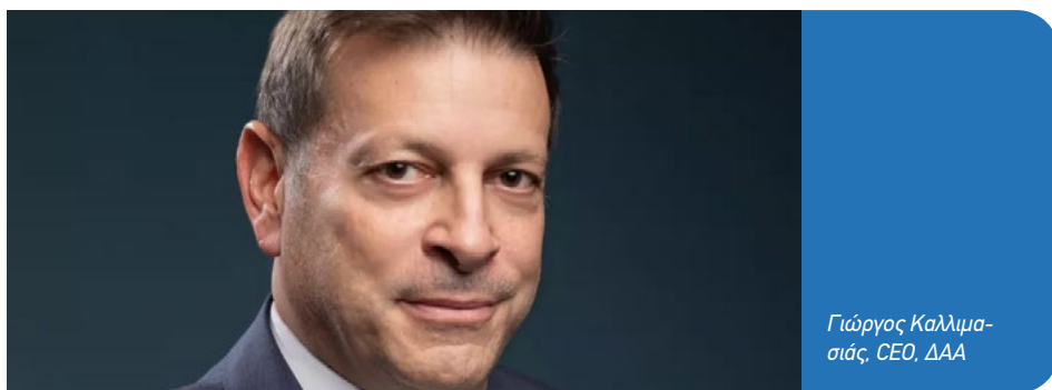
Γιώργος Καλλιμασίς, CEO, ΔΑΑ

Ανοδική πορεία σημείωσαν τόσο οι πτήσεις εσωτερικού όσο και οι διεθνείς πτήσεις, καταγράφοντας αύξηση 7,6% και 7,1% αντίστοιχα, γεγονός που αντανάκλα τη συνεχιζόμενη ενίσχυση της αεροπορικής δραστηριότητας στο μεγαλύτερο αεροδρόμιο της χώρας.