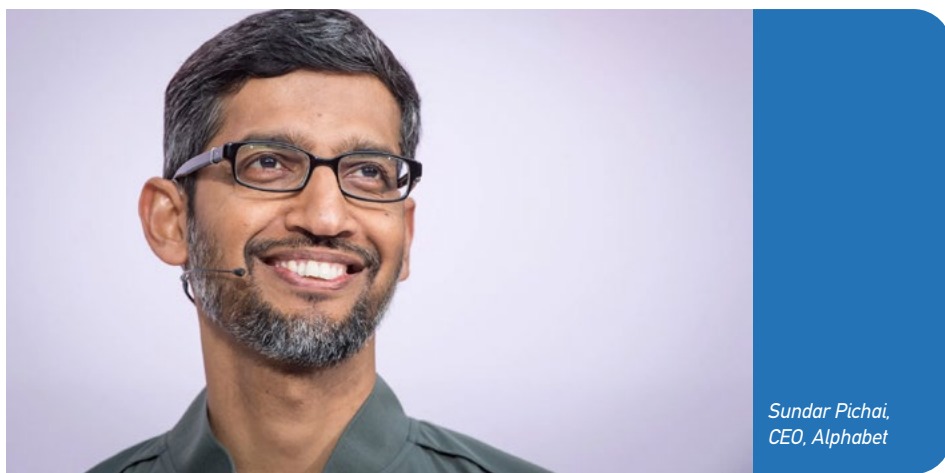
Sundar Pichai, CEO, Alphabet

Η εταιρεία προανήγγειλε ότι οι κεφαλαιουχικές δαπάνες για το 2026 θα αυξηθούν σημαντικά, στα επίπεδα των $175-$185 δισ., επιβεβαιώνοντας τη στρατηγική της για επιθετικές επενδύσεις στην AI. Οι επενδύσεις αυτές αφορούν κυρίως την ενίσχυση των υποδομών cloud, την κατασκευή και αναβάθμιση κέντρων δεδομένων, την ανάπτυξη εξειδικευμένων chips, καθώς και την προέλαση ανθρώπινου δυναμικού.