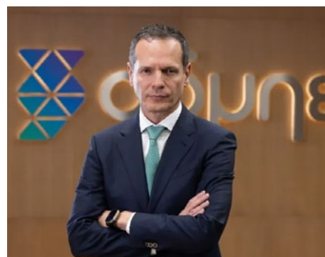
Μάνος Μανουσάκης, Πρόεδρος & CEO, ΑΔΜΗΕ

Αντίστοιχα, θα συγκληθεί Γενική Συνέλευση της ΔΕΣ ΑΔΜΗΕ ώστε να αποφασιστεί η