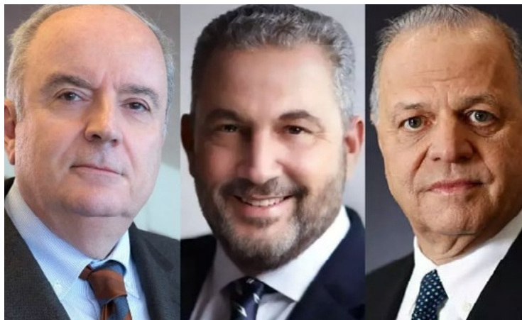
Από αριστερά: Γιώργος Περιστέρης, Πρόεδρος & CEO, ΓΕΚ Τέρνα - Αλέξανδρος Εξάρχου, Πρόεδρος & CEO, Ακτορ - Ευάγγελος Μυτιληναίος, Πρόεδρος, Metlen

Η ΓΕΚ Τέρνα, η οποία μέχρι σήμερα κατείχε το σύνολο των μετοχών των σχετικών εται-