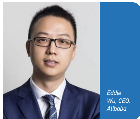
Eddie Wu, CEO, Alibaba

Στο πλαίσιο αυτό, παρουσίασε πρόσφατα την υπηρεσία AI με την ονομασία Wukong, που απευθύνεται σε επιχειρήσεις, ενώ αύξησε