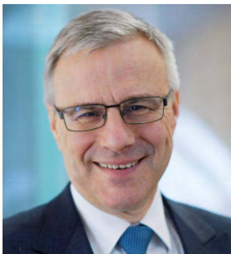
Alain Dehaze, Διευθύνων Σύμβουλος, όμιλος Adecco