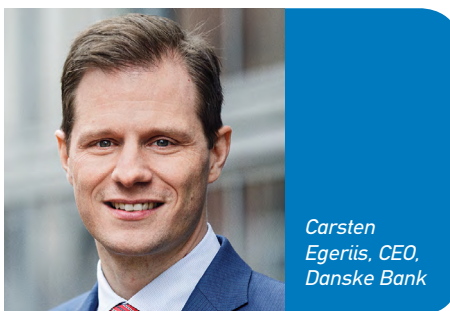
Carsten Egeriis, CEO, Danske Bank

Η Danske Bank αναβάθμισε τις εκτιμήσεις για τα καθαρά κέρδη του 2021, μετά από τις χαμηλότερες του αναμενόμενου χρεώσεις για απομειώσεις δανείων και της υψηλότερης πελατειακής δραστηριότητας. Η μεγαλύτερη τράπεζα της Δανίας, τώρα, αναμένει καθαρά κέρδη, υψηλότερα των 12 δισ. κορόνων ($1,9 δισ.) το 2021, υψηλότερα από τις προηγούμενες εκτιμήσεις που έκαναν λόγο για 9-11 δισ. κορόνες.