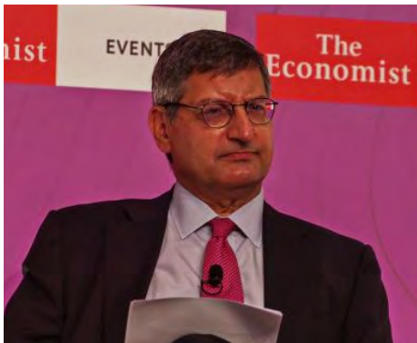
Πάυλος Μυλωνάς, CEO, Εθνική Τράπεζα

"Πολιτικές που οδηγούν τις μικρομεσαίες επιχειρήσεις, να συμμορφωθούν με τους κανόνες του παιχνιδιού, ή πολιτικές, όπως η προώθηση του ψηφιακού μετασχηματισμού, σε συνδυασμό με τη μεγαλύτερη διαφάνεια στις συναλλαγές, θα λειτουργήσουν υποστηρικτικά", ανέφερε χαρακτηριστικά. Παράλληλα, η εφαρμογή μέτρων που θα παρέχουν κίνητρα συγχώνευσης στις μικρές επιχειρήσεις, όπως η απευθείας πρόσβαση στους πόρους του Ταμείου Ανάκαμψης, μπορεί να αποτελέσει το προσδοκώμενο κέρδος που θα κινητοποιήσει τις μικρές επιχειρήσεις να εκσυγχρονιστούν, να γίνουν παραγωγικότερες και πιο συνεπείς φορολογικά. Είναι θετικό, κα-