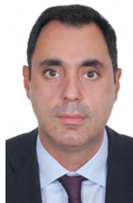
Ιωάννης Σμυρλής, Γενικός Γραμματέας Διεθνών Οικονομικών Σχέσεων & Εξωστρέφειας, Υπουργείο Εξωτερικών, Πρόεδρος της Enterprise Greece

αση της αντιμονοπωλιακής νομοθεσίας", τόνισε η γερμανική αυτοκινητοβιομηχανία μετά την επιβολή του προστίμου.