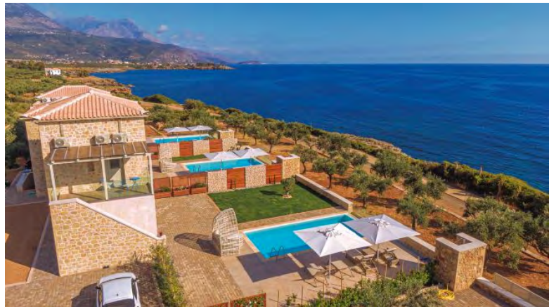
Το χωριό διαθέτει δύο παραλίες με πεντακάθαρα νερά και παχιά άμμο, την Στούπα και την Καλογριά.

Το παραθαλάσσιο αυτό χωριό απέχει μόλις 45 χλμ ανατολικά από την πόλη της Καλαμάτας και 55 χιλιόμετρα από το διεθνές αεροδρόμιο της Καλαμάτας.