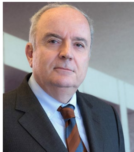
Γιώργος Περιστερίης, CEO, ΓΕΚ Τέρνα

Οι δικηγόροι του απέσυραν δύο κατηγορίες, απάτη και τεκμαιρόμενη απάτη - πριν από τη δίκη, με στόχο την "απλοποίηση της υπόθεσης".