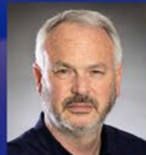
Tim Mashall Journalist & broadcaster, bestselling author on international affairs