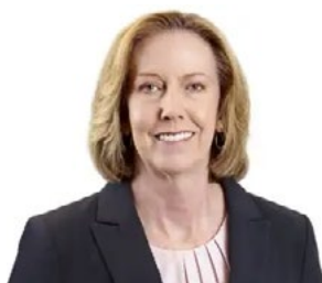
Meg O'Neill, CEO, BP

Η εταιρεία απέδωσε τα αποτελέσματα σε "εξαιρετικές" επιδόσεις στο trading πετρελαίου και ισχυρότερη δραστηριότητα στον τομέα μεταφοράς και αποθήκευσης. Η CEO της εταιρείας, Meg O'Neill, δήλωσε ότι πρόκειται για ακόμη ένα τρίμηνο ισχυρών λειτουργικών και οικονομικών επιδόσεων, με πρόοδο προς τους στόχους του 2027. Σημειώνεται πως τα υποκείμενα κέρδη (με βάση κόστος αντικατάστασης)