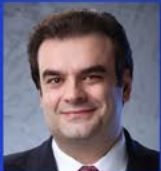
Κυριάκος Πιερρακάκης Υπουργός Εθνικής Οικονομίας και Οικονομικών