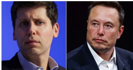
Sam Altman, Elon Musk

Η δικαστής ξεκίνησε τη διαδικασία καλωσορίζοντας τους υποψήφιους ενόρκους, ενώ δεν έλειψαν και ορισμένα σχόλια με χιούμορ