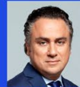
Νίκος Φιλππίδης Δημοσιογράφος, Οικονομικός Αναλυτής SKAI TV, Αρθρογράφος εφημερίδα Η ΚΑΘΗΜΕΡΙΝΗ