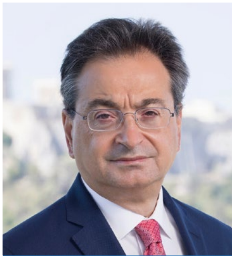
Φωκίων Καραβίας, CEO, Eurobank

"Η ανθεκτικότητα στις κρίσεις αποκτάται κατά τη διάρκεια των ομαλών περιόδων, ενδεχομένως σε αντίθεση με απόψεις που ζητούν πιο χαλαρή πολιτική στο δημόσιο ή χρημα-