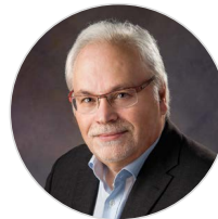
G. Pavlakis National Cancer Institute U.S.A.