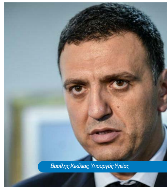
Βασίλης Κικίλιας, Υπουργός Υγείας

Η πρώτη δόση που θα πάρουμε - είπε - είναι κάτι παραπάνω από 700.000 εμβόλια και θα προηγηθούν οι ευπαθείς ομάδες και οι υγειονομικοί σε πρώτη φάση. Εξέφρασε τη χαρά του για την αλληλεγγύη, καθώς - μέσω της Ευρωπαϊκής Επιτροπής - αγοράζουμε τα εμβόλιά μας από εταιρείες, οι οποίες είναι πιο μπροστά στο χρόνο και μένει να αποδειχθεί επιστημονικά ότι τα εμβόλιά τους είναι ασφαλή και αποτελεσματικά. Ο υπουργός τόνισε πως ακολουθούν και άλλες εταιρείες, οι οποίες έχουν υπογράψει προσύμφωνο. Είναι κοντά στις συμφωνίες με την Ευρωπαϊκή Επιτροπή, έτσι ώστε ο αριθμός των εμβολίων να καλύψει όλους τους συμπολίτες μας σε όλες τις ευρωπαϊκές χώρες.