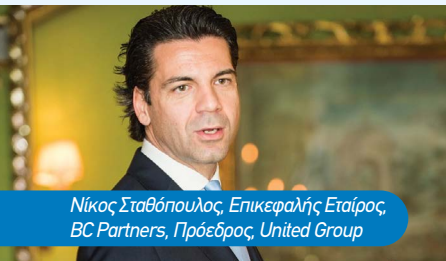
Νίκος Σταθόπουλος, Επικεφαλής Εταίρος, BC Partners, Πρόεδρος, United Group

“ Η πορεία και ο χρόνος εξαγοράς εξαρτώνται καθαρά από την United.