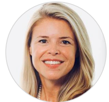
N. Moll EFPIA