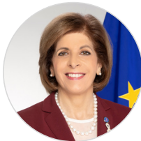
S. Kyriakides Commissioner Health and Food Safety, EC