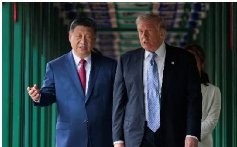
Χι Jinqing, Πρόεδρος, Κίνα - Donald Trump, Πρόεδρος, ΗΠΑ

Ο Trump δήλωσε επίσης ότι η Κίνα συμφώνησε να αγοράσει 200 αεροσκάφη της Boeing, αριθμός χαμηλότερος από τις προσδοκίες των αγορών, οδηγώντας σε πιέσεις τη μετοχή της εταιρείας.