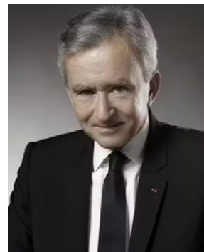
Bernard Arnault Πρόεδρος και CEO, LVMH

Η πορεία της LVMH έχασε δυναμική στις αρχές του 2026, καθώς η σύγκρουση στην Μέση Ανατολή περιόρισε τις αγορές ειδών