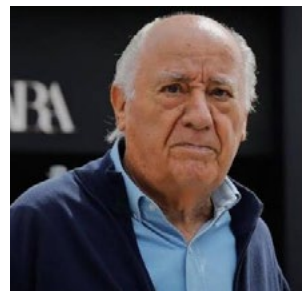
Amancio Ortega, ιδρυτής, Inditex Group

Παρότι οι συναλλαγές ακίνητης περιουσίας για εμπορική εκμετάλλευση είχαν αρχίσει να ανακάμπτουν πριν από την έναρξη του πολέμου στην Μέση Ανατολή, οι συμφωνίες για