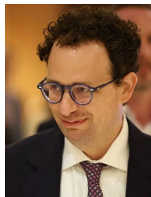
Dario Amodei, CEO, Anthropic

Το chatbot Claude και το εργαλείο Claude Code για AI-assisted προγραμματισμό έχουν γίνει ιδιαίτερα δημοφιλή φέτος, αυξάνοντας δραματικά τις ανάγκες της εταιρείας για υπολογιστική ισχύ. Την Τετάρτη, η SpaceX αποκάλυψε ότι η Anthropic θα καταβάλλει $1,25 δισ. τον μήνα έως τον Μάιο του 2029 για υπολογιστική ισχύ. Η Anthropic βασιζόταν κυρίως σε GPUs της Nvidia για την εκπαίδευση και λειτουργία μο-