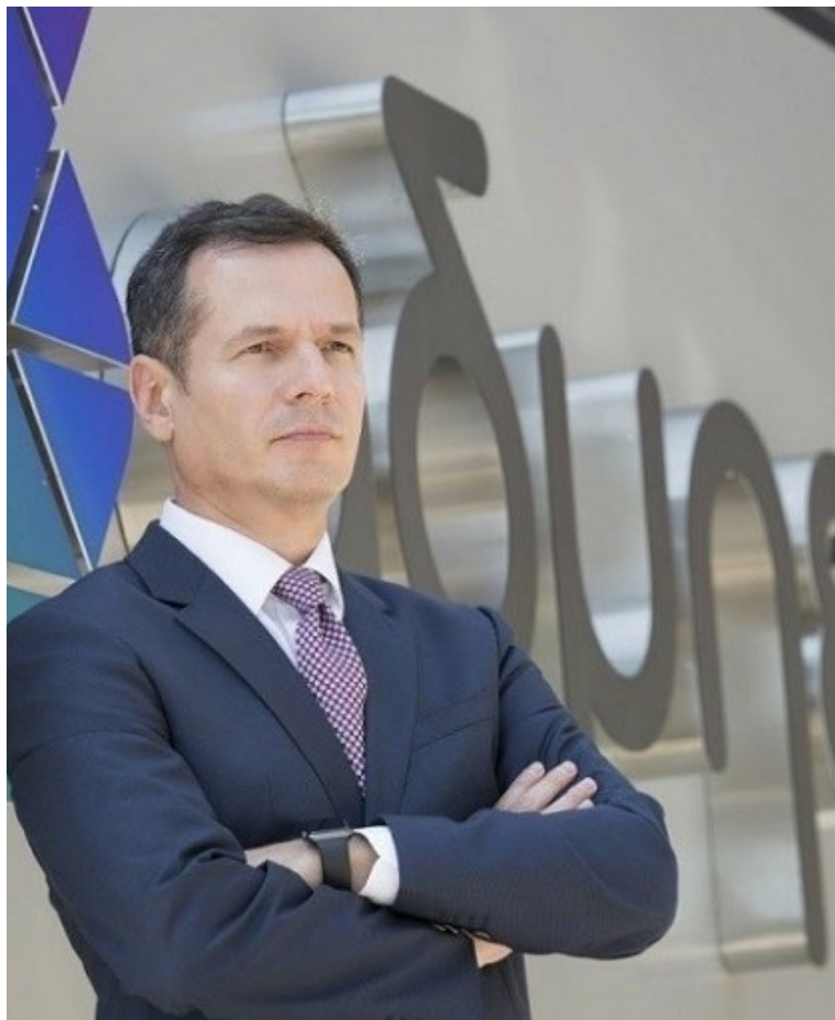
Μανούσος Μανουσάκης, Πρόεδρος & Διευθύνων Σύμβουλος, ΑΔΜΗΕ

Με βάση τον υφιστάμενο σχεδιασμό, η ΔΕΣ ΑΔΜΗΕ αναμένεται να εισφέρει περίπου €250 εκατ., ενώ η State Grid θα συμμετάσχει με περίπου €240 εκατ., ενισχύοντας την κεφαλαιακή βάση του Διαχειριστή ενόψει της επόμενης επενδυτικής φάσης. Η ΑΔΜΗΕ Συμμετοχών σχεδιάζει την έκδοση 250 εκατ. νέων κοινών μετοχών με δικαίωμα ψήφου, ενώ το διοικητικό συμβούλιο αναμένεται να εισηγηθεί την κατάργηση του δικαιώματος προτίμησης. Από τα συνολικά €530 εκατ. που επιδιώκεται να αντληθούν, περίπου €270,8 εκατ. αντιστοιχούν στη συμμετοχή της ΔΕΣ ΑΔΜΗΕ και περίπου €259,1 εκατ. στους λοιπούς μετόχους και επενδυτές.