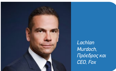
Lachlan Murdoch, Πρόεδρος και CEO, Fox

Η συμφωνία συνδυάζει το χαρτοφυλάκιο ζωντανών μεταδόσεων της Fox - συμπεριλαμβαν-