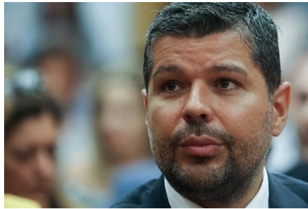
Γιώργος Στάσης, CEO, ΔΕΗ

Σημαντική μείωση των ζημιών παρουσίασε η ΔΕΗ το α' εξάμηνο του τρέχοντος έτους.