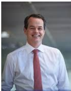
Maurice Tulloch, CEO, Aviva

Η γερμανική ασφαλιστική Allianz, η Nippon Life και η MS&AD Insurance μπαίνουν στην κούρσα για την εξαγορά των δραστηριοτήτων της βρετανικής Aviva σε Σιγκαπούρη και Βιετνάμ. Πρόκειται για ένα deal αξίας έως και 2,5 δισ. δολαρίων σύμφωνα με το Reuters, που επικαλείται καλά πληροφορημένες πηγές. Η канаδική Sun Life Financial είναι επίσης μεταξύ των έξι πιθανών μνηστών για τις δραστηριότητες της Aviva, με τις διαπραγματεύσεις να βρίσκονται σε πολύ αρχικό στάδιο. Οι υψηλοί ρυθμοί ανάπτυξης των συγκεκριμένων οικονομιών και το σχετικά χαμηλό ποσοστό ασφάλισης τις καθιστούν πολλά υποσχόμενες για τους μεγάλους παίχτες του κλάδου.