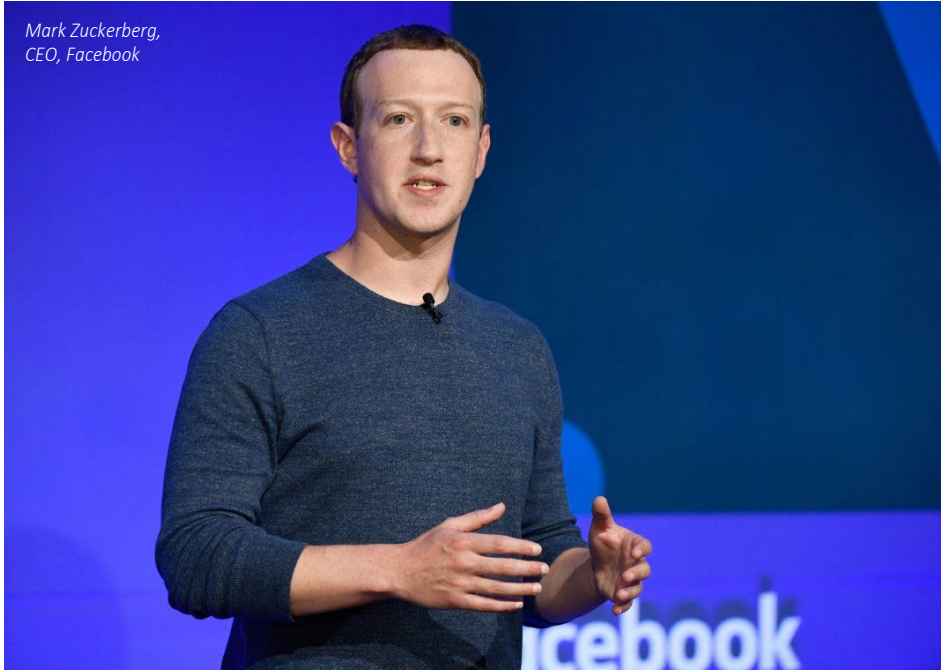
Mark Zuckerberg, CEO, Facebook

Η Facebook συμφώνησε να εξαγοράσει μία startup που δίνει τη δυνατότητα στους ανθρώπους να ελέγχουν τους υπολογιστές με το μυαλό τους -μία μακρόπνοη φιλοδοξία του CEO, Mark Zuckerberg. Η προτεινόμενη εξαγορά της CTRL-Labs, μιας εταιρείας που ιδρύθηκε προ τετραετίας και αναπτύσσει λογισμικό και ένα βραχιόλι που μετρά τη δραστηριότητα των νευρώνων στο βραχίονα του υποκειμένου, εκτιμάται ότι θα έχει τίμημα μεταξύ 500 εκατ. δολ. και 1 δισ. δολ., σύμφωνα με δημοσιεύματα.