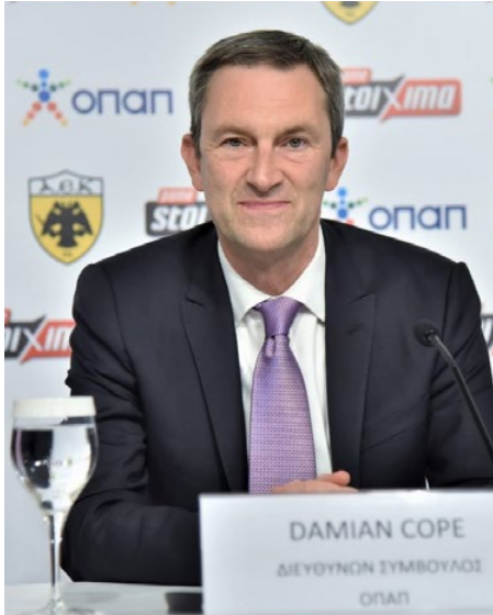
Ντάμιαν Κόουπ, CEO, ΟΠΑΠ

Σε επικοινωνία με τους αρμόδιους φορείς, συμπεριλαμβανομένης της Επιτροπής Εποπτείας και Ελέγχου Παιγνίων (ΕΕΕΠ), προκειμένου να αναληφθούν όλες οι ενδεδειγμένες ενέργειες, βρίσκεται ο ΟΠΑΠ μετά